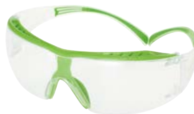
3M™ セキュアフィット™ 保護めがね クリア SF401XSGAF-GRN