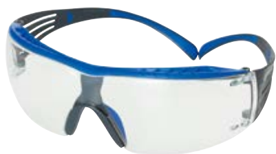
3M™ セキュアフィット™ 保護めがね クリア SF401XSGAF-BLU